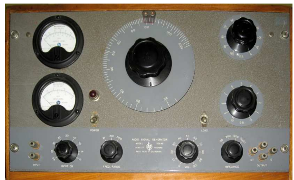
De HP audiogenerator in houten kast

Daan Minderhoud gaf een HP audiogenerator model 205AG.