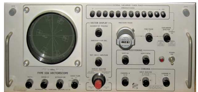
De Tektronix type 526 Vectorscope

Bij het begin van de kleurentelevisie in 1967 was op elk TV zendstation een meetapparaat aanwezig voor het meten van de fase van het kleurensignaal. De hiervoor gebruikte Tektronix vectorscope type 526 miste nog in de verzameling van het OZM.