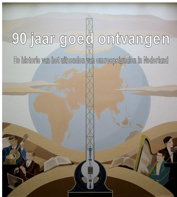
90 jaar goed ontvangen

Het allereerste begin van radio omroep in Nederland is al meer dan 90 jaar geleden. Vandaar de titel van ons boek.