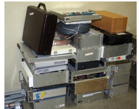
Meet- en testapparatuur