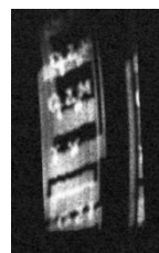
Het beeld op de Nipkow schijf

Door het toerental met de hand in te stellen is het begin deze maand gelukt een min of meer zichtbaar beeld te krijgen.