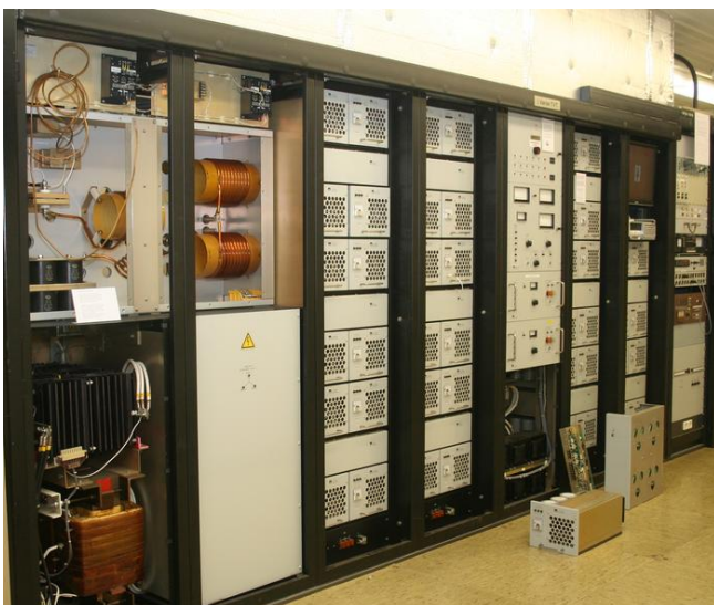
Tot 1 september 2015 was dit de reservezender van Radio5 Nostalgia, nu te zien het OZM.

Met filmpjes en apparaten uit de historie en natuurlijk ook middengolfontvangst op onze historische radio's. Bij ons is de middengolf nog lang niet stil!