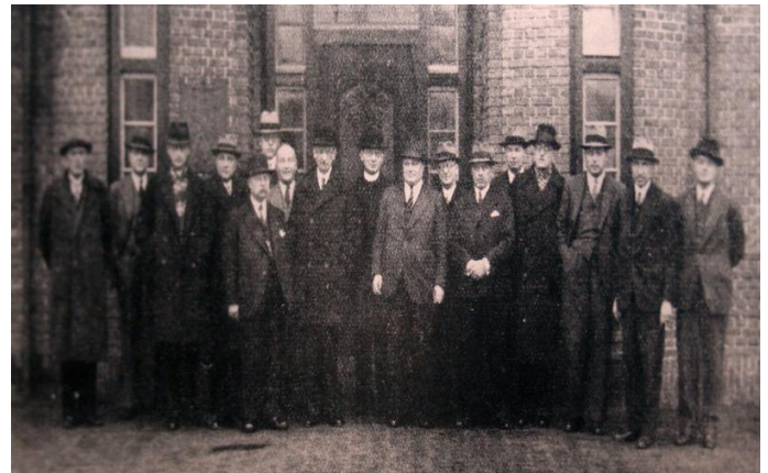
De raad van beheer van Nozema omstreeks 1939.

En om de verassing compleet te maken stond op hetzelfde paneel haar vader op een andere foto.