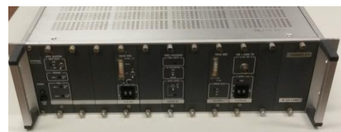
Een Hirschman TV unit

Alle gevers van dit materiaal nogmaals hartelijk dank.