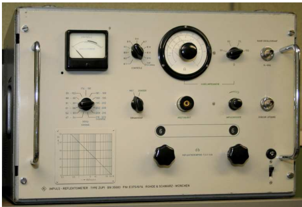
impuls- reflektometer type ZUPI