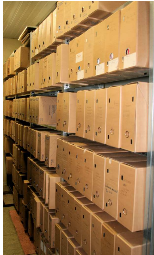
Een deel van het archief

Verder is apparatuur documentatie uit alle hoeken en gaten opgezocht en op volgorde in kasten opgeborgen. Wel zo makkelijk als we schema's zoeken om oude apparaten weer te kunnen laten werken.