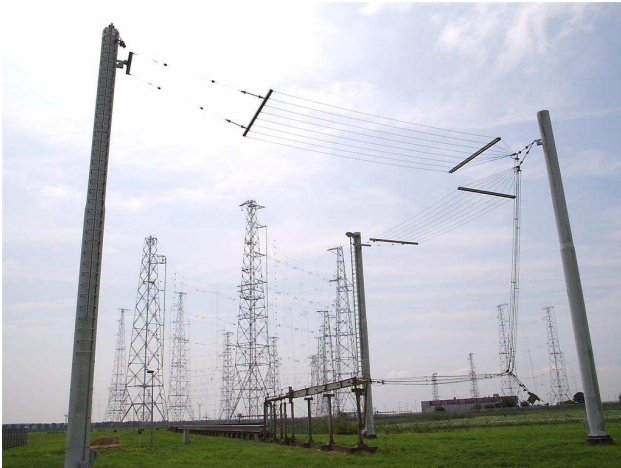
Rondstraal antenne voor Europa