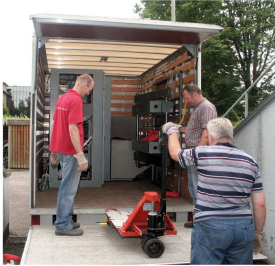
De auto is weer bijna leeg

Nadat de auto was gelost en de spullen in het goede vertrek waren neergelegd was er weer een dag om. Per verhuisdag werkten tussen de 3 en 5 mensen mee.