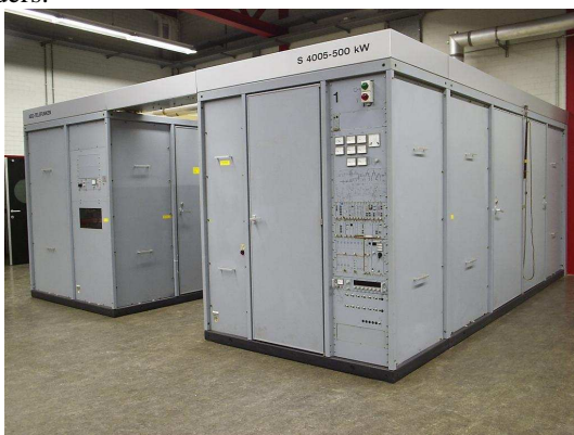
Zender 1, één van de vier 500 kW zenders

Nu op dit moment – na de sluiting van het station eind 2007 – de ontmanteling van het korte golf zendstation Flevoland in volle gang is blijkt ook hoe snel unieke technieken en installaties kunnen verdwijnen van een station. In dit geval moeten we helaas spreken van het verdwijnen van de korte golf omroep uit Nederland. In de maanden juli en september 2008 heeft een vrijwilliger van het museum met hulp van een voormalig bemanningslid van het station vele uren gestoken in het fotograferen van details van het antenne park en de (inmiddels vrijwel geheel ontmantelde) korte golf zenders.