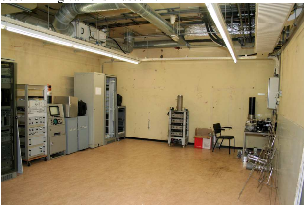
Klaar voor het plaatsen van TV zenders

Dit voorjaar kregen we toestemming van KPN/ BCS om onze collectie onder te brengen in vrije ruimten in de bunker naast het kantoorgebouw van BCS in Lopikerkapel. Nou, de vertrekken waren niet echt leeg, ze lagen "tot de nok" toe vol met spullen en rommel. Het zag er uit of alles wat de laatste 20 jaar niet direct een bestemming had of nog moest worden afgevoerd in deze vertrekken lag. In de loop van de maand mei is begonnen met het opruimen in de bunker. Container na container is afgevoerd, gespitst in chemisch afval, metaal en papier. Medio juli was het meeste afgevoerd. In totaal zijn aan het opruimen zo'n 30 tot 40 mandagen besteed, dit inclusief wat interne verhuizingen in de bunker. Hiermee kwamen er dan 8 grotere en kleinere vertrekken ter beschikking van ons museum.