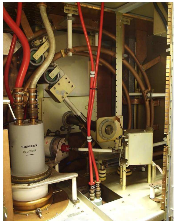
De HF Eindtrap met de Siemens buis RS 2078 SK. Deze buis is gelijk aan de meestal gebruikte Thomson TH558

De zenders zijn nu grotendeels gedemonteerd, over de toekomst van het gebouw en in het bijzonder de antennes valt echter nog niet veel te melden. De mogelijkheid van overname door een geïnteresseerde partij of gebruiker bestaat nog steeds.