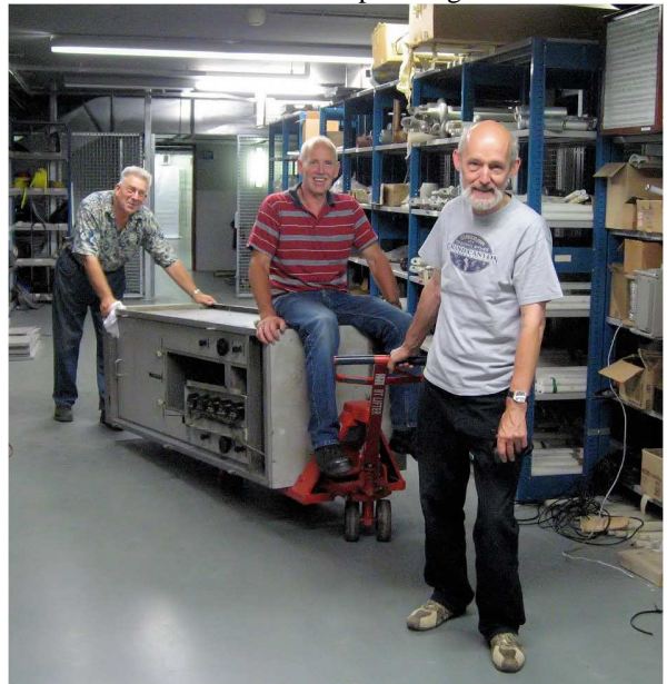
Rijdende Philips FM zender in kelder Flevo

verzameld beslaan zo'n 250 m2. Gezien het karakter van de bunker met nauwe toegang en kleine vertrekken moest het verhuizen in relatief kleine porties gebeuren.