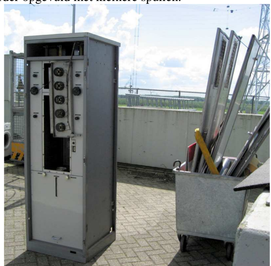
Philips FM zender geniet van de zon

Op basis van een globale papieren indeling van de nieuwe vertrekken is vanaf begin juli gemiddeld 1 x per week een auto vol gehaald. Altijd met een aantal grote kasten en verder opgevuld met kleinere spullen.