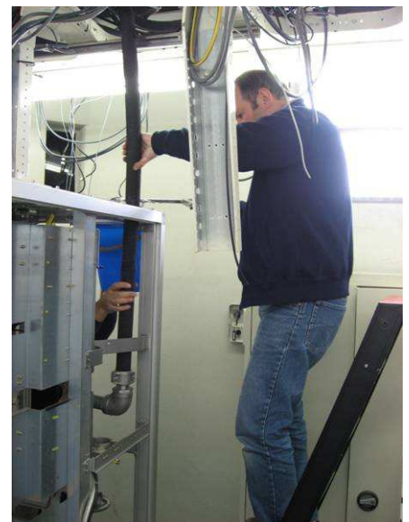
Ries zet de zaag in de watertoevoer

Precies, het stroomde weer volop, maar nu over de vloer.